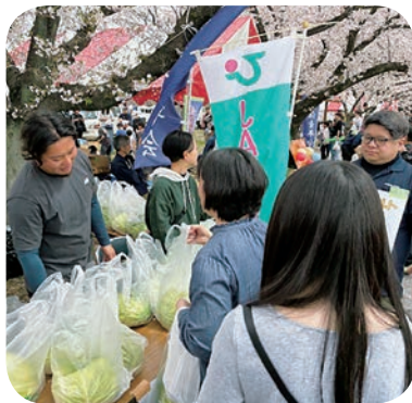
暑い天気の中最後までたくさんの人々で賑わいました