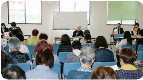
上里地区女性部（5月8日）

連合女性部及び各地区女性部の総会後には、女性部員の有志によるどじょうすくい踊りや、日頃から取り組んでいるハンドベルや大正琴の演奏や、(株)厚生産業による商品紹介や(株)サンギによる口腔ケア講座などが行われました。