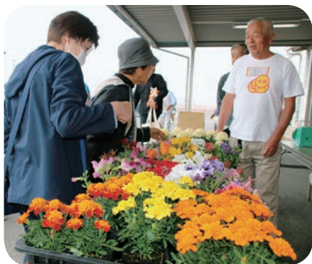
あおぞら館での花苗木まつり