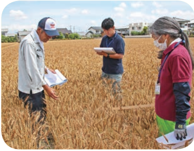
種子小麦圃場審査会