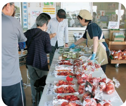
おいしいトマトときゅうりが振舞われました

直売所のおまつりが たくさんのお来場者で賑わいました 4月から5月にかけてJA直売所で沢山のイベントが開催されました。かみかわ館では4月18日から5月10日までの期間に「花・植木・野菜まつり」を開催。期間中の土日には2千円以上お買い上げのお客様に粗品を贈呈するキャンペーンを実施しました。4月25日、26日にはあおぞら館とこだま館で「花苗木まつり」を開催し、こちらではポット苗のプレゼントと玉ねぎの詰め放題が大好評でした。5月16日と17日にはあおぞら館で開催した「きゅうり・トマトまつり」にJAのキャンペーン隊が参加し、地元のプロデューサーが丹精込めて作ったきゅうりとトマトの試食を来場者に振舞いました。