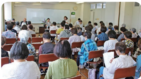
神川地区女性部（5月20日）