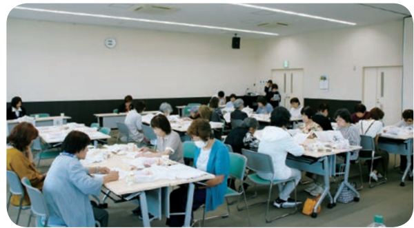
美里地区女性部（5月19日）