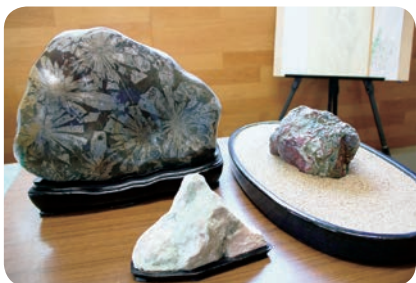
それぞれの石に唯一無二の個性があるところが魅力だそうです

また、自然石を自然や山水の景色に見立てて鑑賞することは「水石」と呼ばれる日本の伝統文化で、現在盆栽とともに世界無形文化遺産に申請されています。