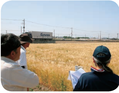
ビール種子圃場審査会