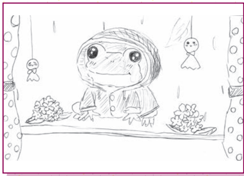
じゅんちゃんさん

【編】てるてる坊主を下げているところを見ると、もしかしたら晴れてほしかったのでしょうか？いずれにしても、「雨の日のおでかけもいいなあ」と思える素敵なイラストですね。