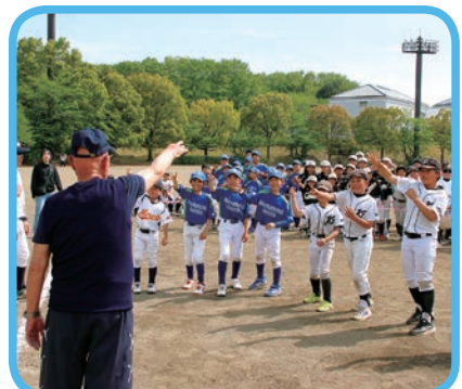
勝利したリトルジャガーズ