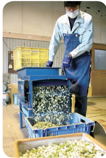
花粉銀行での作業の様子