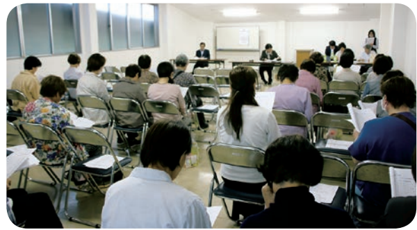
本庄地区女性部（5月8日）