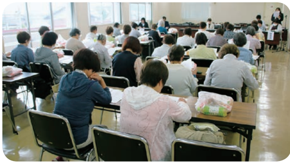
児玉地区女性部（5月13日）