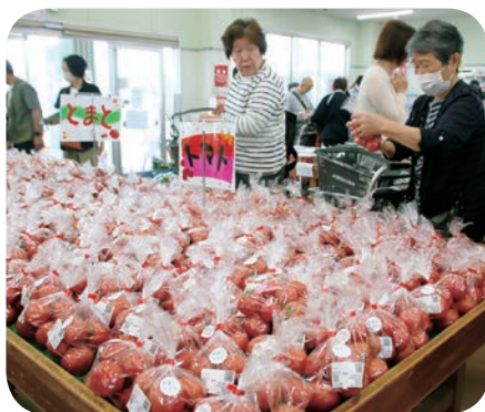
きゅうり・トマトまつり