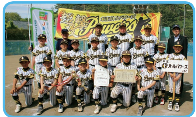
★準優勝 本庄リトルパワーズ