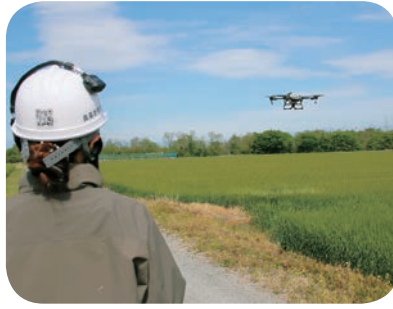
上里地区 — 空中散布の様子 —