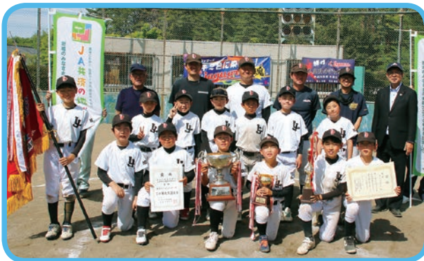
★優勝 本庄リトルジャガーズ