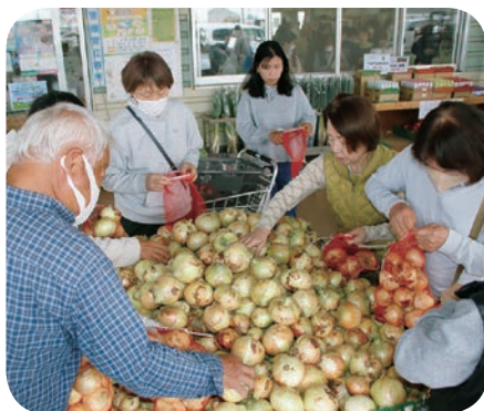
好評だった玉ねぎの詰め放題

直売所のおまつりが たくさんのお来場者で賑わいました 4月から5月にかけてJA直売所で沢山のイベントが開催されました。かみかわ館では4月18日から5月10日までの期間に「花・植木・野菜まつり」を開催。期間中の土日には2千円以上お買い上げのお客様に粗品を贈呈するキャンペーンを実施しました。4月25日、26日にはあおぞら館とこだま館で「花苗木まつり」を開催し、こちらではポット苗のプレゼントと玉ねぎの詰め放題が大好評でした。5月16日と17日にはあおぞら館で開催した「きゅうり・トマトまつり」にJAのキャンペーン隊が参加し、地元のプロデューサーが丹精込めて作ったきゅうりとトマトの試食を来場者に振舞いました。