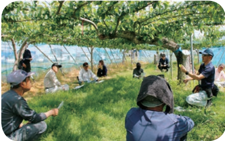
上里地区（5月13日） — 新梢管理講習会の様子 —