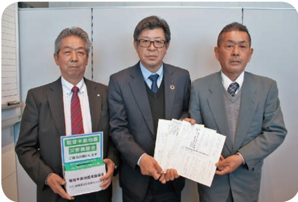
高額利用者の集い