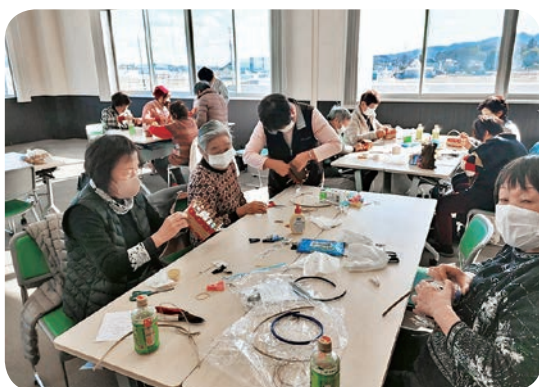
クラフトかご作りに取り組む参加者