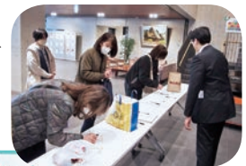
大勢の職員が参加しました▶

持ち寄られた食品は3月19日に行われた贈呈式にて本庄市社会福祉協議会へ引き渡されました。社会福祉協議会の事務局長は「生活困窮者等の必要としている方々へお届けさせていただきます」と話してくださいました。