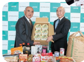
◀岩田専務(写真左) 社会福祉協議会事務局長(写真右)