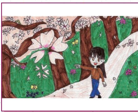
コザクラインコさん

〔編〕春が来て暖かくなるこの時期は体を動かしたくなります。何かをはじめするにはぴったりの季節ですね。