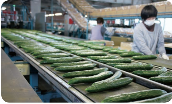
ひびきの南部選果場