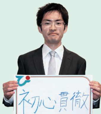
本庄宮農経済センター係

4月から新たに6名がJA職員として仲間入りしました。 組合員の皆さまを始め、ご利用者の皆さま、地域の皆さまのお役に立てるよう 精一杯努力してまいりますので、温かい応援をよろしくお願い申し上げます。