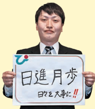
宮農経済部 農機自動車センター係