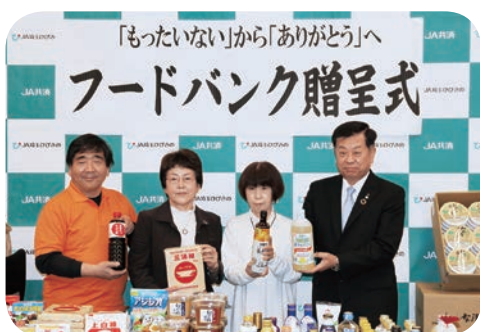
食品を寄付する塩谷組合長(右)と女性部役員(中2人)

善意で多数の食品を寄付頂きました。食品ロスをなくし必要としている方に届いたらと思ひ、この活動を続けてまいります」と挨拶をしました。この他J Aから「彩のかがやき」パックご飯150食分も寄贈されました。