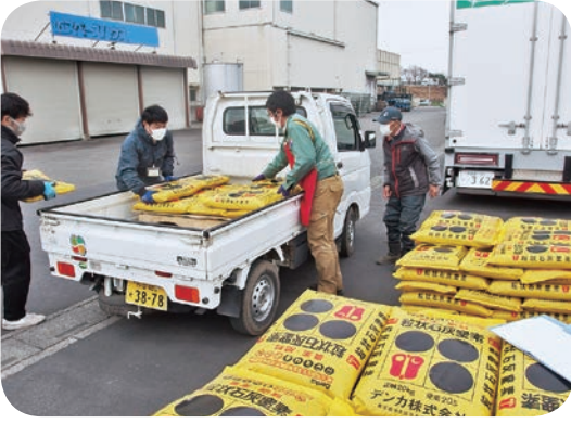
肥料即売会の様子

2月24日に上里営農経済センターにて肥料価格高騰に対する組合員の営農支援のため、特別価格での肥料即売会を開催しました。