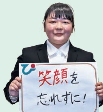
宮農経済部 宮農販売課係